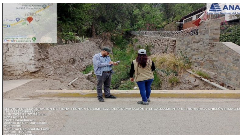
FIGURA N° 02: TRAMO CRÍTICO PUENTE PETONAL Y VEHICULAR EXPUESTOS EN LA QUEBRADA LA CRUZ, SECTOR LA CRUZ, DISTRITO DE SANTA CRUZ DE COCACHACRA, PROVINCIA DE HUAROCHIRI, DEPARTAMENTO DE LIMA