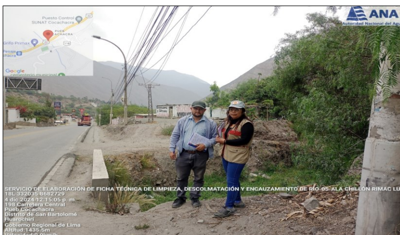
FIGURA N° 03: TRAMO CRÍTICO CARRETERA CENTRAL Y PUENTE CARRETERA CENTRAL EXPUESTOS EN LA QUEBRADA LA CRUZ, SECTOR LA CRUZ, DISTRITO DE SANTA CRUZ DE COCACHACRA, PROVINCIA DE HUAROCHIRI, DEPARTAMENTO DE LIMA