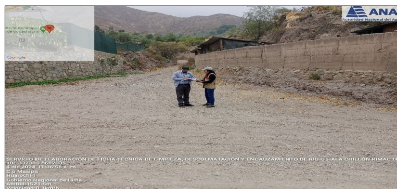
FIGURA N° 01: TRAMO CRÍTICO BADEN Y VIA EXPUESTO EN LA QUEBRADA DE LA CRUZ, SECTOR LA CRUZ, DISTRITO DE SANTA CRUZ DE COCACHACRA, PROVINCIA DE HUAROCHIRI, DEPARTAMENTO DE LIMA